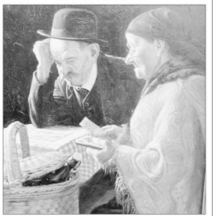
«La partita a carte» di Achille Gisenti, tra i migliori dipinti in esposizione

La forza della pittura bresciana nei due nuovi anni dell'Arnaldo